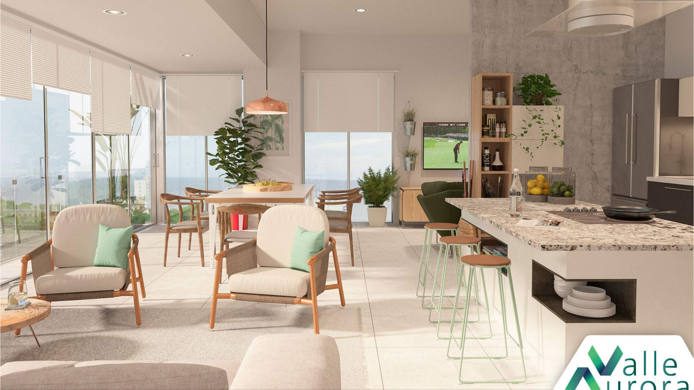
Penthouse con roof garden y alberca.