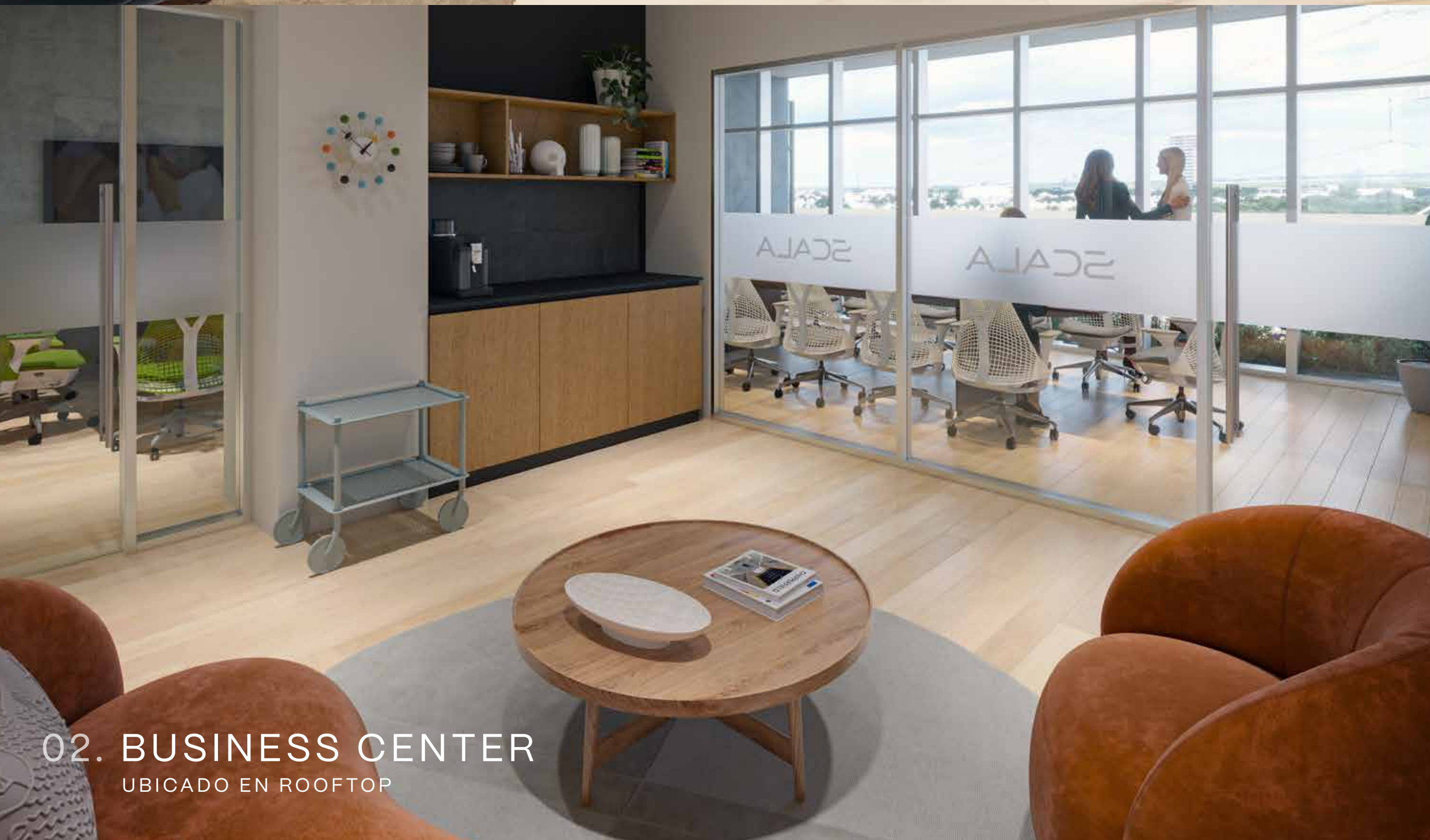
02. BUSINESS CENTER UBICADO EN ROOFTOP