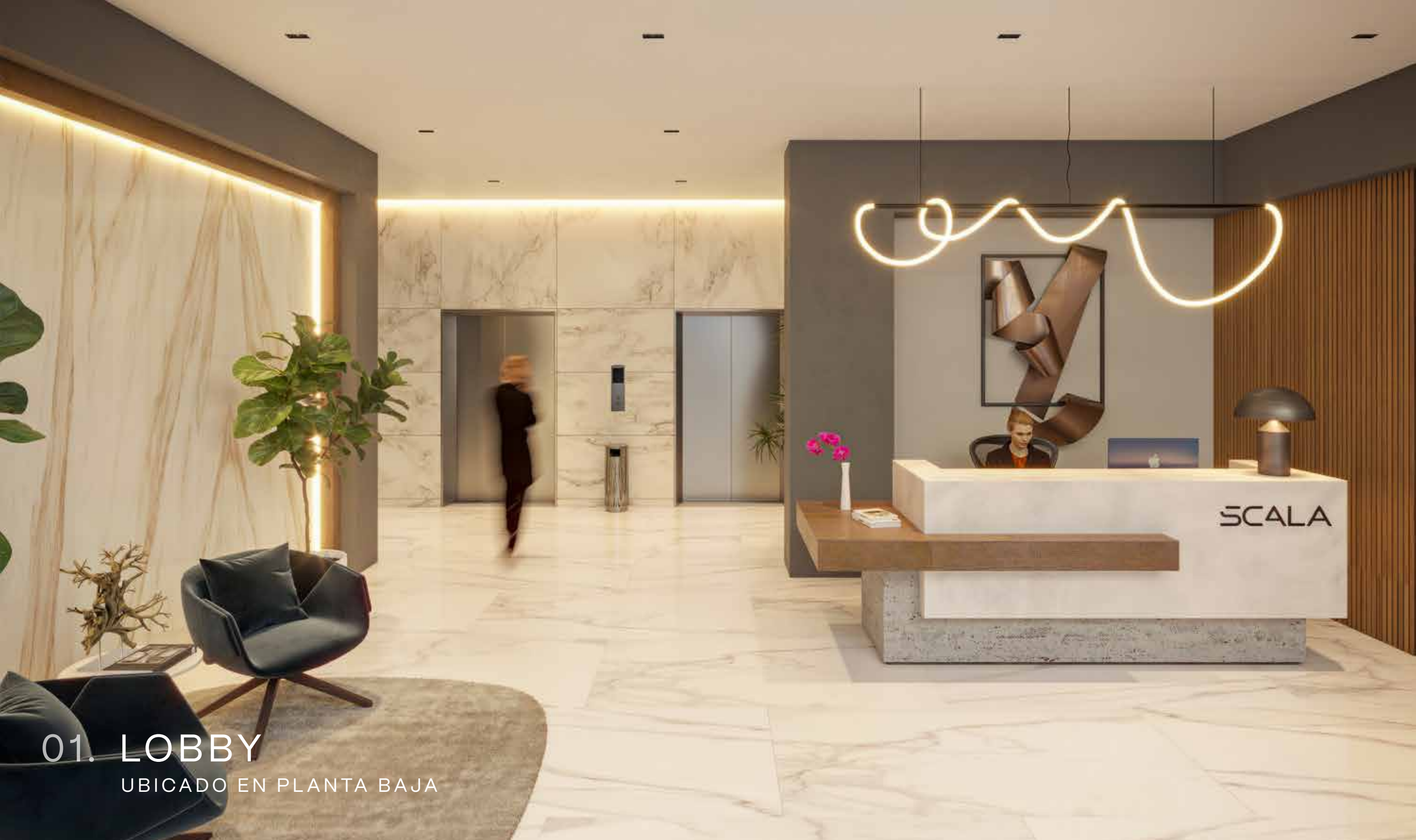
01. LOBBY UBICADO EN PLANTA BAJA