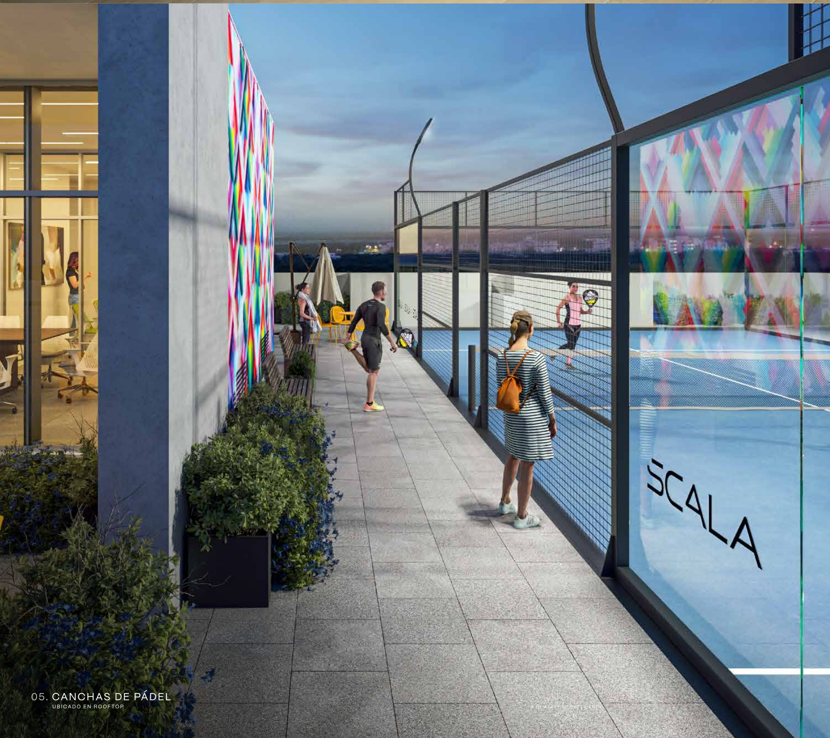
05. CANCHAS DE PÁDEL UBICADO EN ROOFTOP