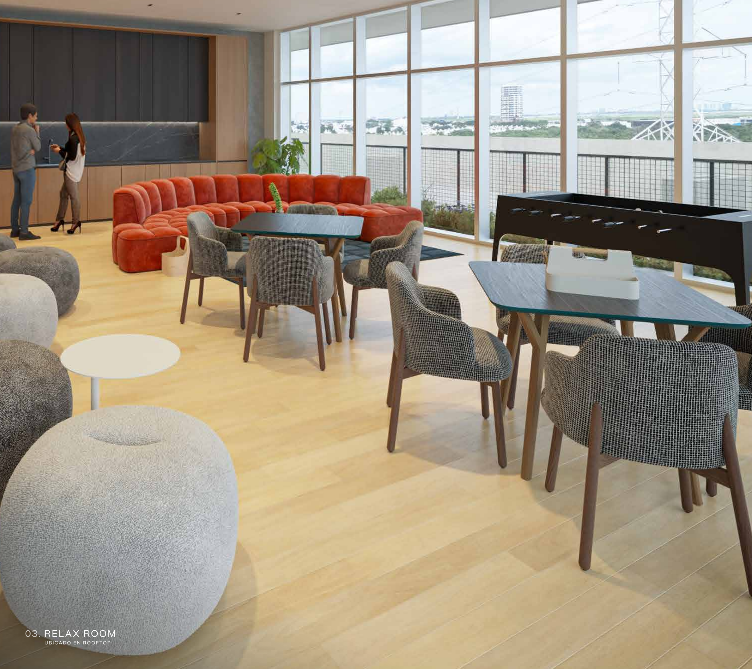
03. RELAX ROOM UBICADO EN ROOFTOP